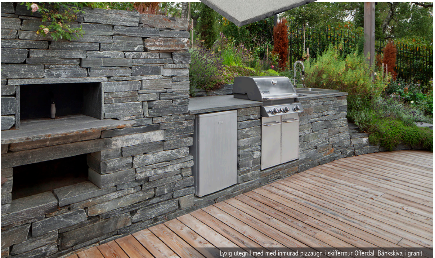
Lyxig utegrill med med inmurad pizzaugn i skiffermur Offerdal. Bänkskiva i granit.