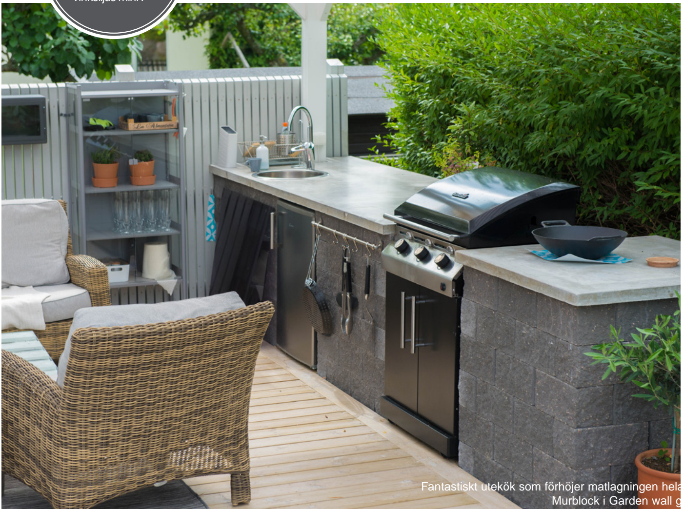
Fantastiskt utekök som förhöjer matlagningen hela året. Bänkskiva i betong och Murblock i Garden wall g

På bilderna är bänkskivorna i betong, men välj det du tycker blir bäst. Vill du ha det lite smidigt kan du köpa en färdig bänkskiva i granit 90x60 eller trä. Beskrivning på hur du gjuter en bänkskiva i betong finns på nästa sida.