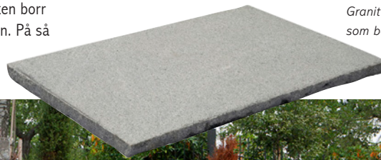
Granit grafit 90x60x3cm används som bänkskiva nedan.

9. En betongskiva väger en ganska mycket, mellan 100-200 kilo. Ha med i planeringen att gjuta betongskivan så nära platsen där den sedan ska ligga som möjligt. Ta gärna hjälp av flera personer när den skall läggas på plats.