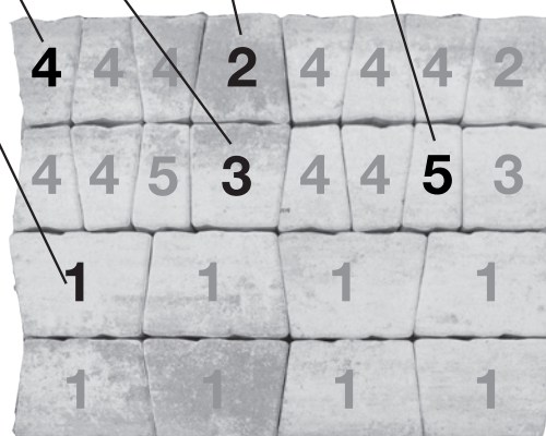
Placering på pall vid leverans.

På bilden till höger visas stenarnas placering på pall vid leverans.